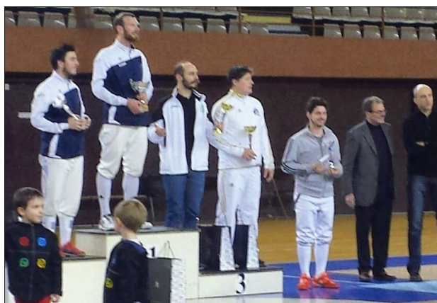
Podium du tournoi Jean-Clouet